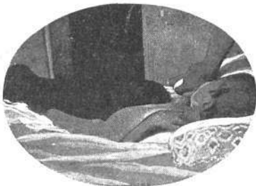
El primer caso de peste producido hace un mes en Formosa