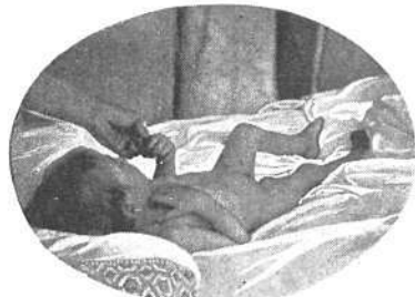
El segundo caso de peste bubónica registrado en Formosa